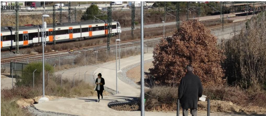
Accés al parc per a vianants i ciclistes des de l'estació Cerdanyola-Universitat (10 minuts)

El Parc de l'Alba – BSP acaba de finalitzar la construcció d'un camí pavimentat i il·luminat que permet als usuaris que baixen del tren a l'estació Cerdanyola Universitat , arribar en 10 minuts al parc.