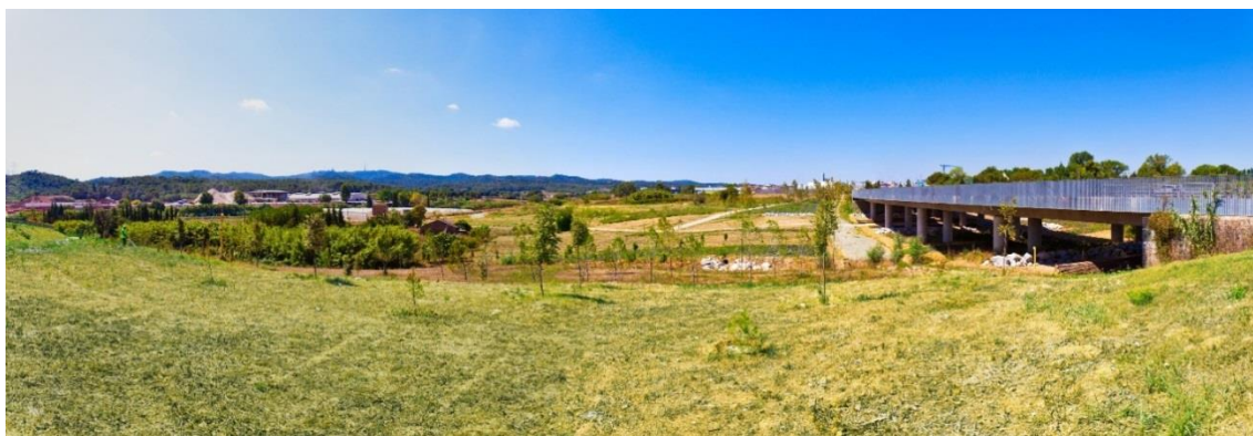
Carretera BP-1413 Sant Cugat-Cerdanyola reconstruïda pel parc amb els seus viaductes (a la dreta) que permeten el pas de la fauna i la configuració del corredor biològic

Des del primer disseny del parc, el plantejament de l'espai va definir un conjunt harmoniós de sectors on les àrees empresarials i residencials conviuen amb les destinades als cultius, torrents i boscos, i on es conserva un extens connector biològic en el qual s'està treballant per tal de millorar la permeabilitat de la fauna; en particular, ja s'han construït dos viaductes al pas pel corredor verd de la carretera BP-1413 Cerdanyola-Sant Cugat renovada pel Parc de l'Alba – BSP.