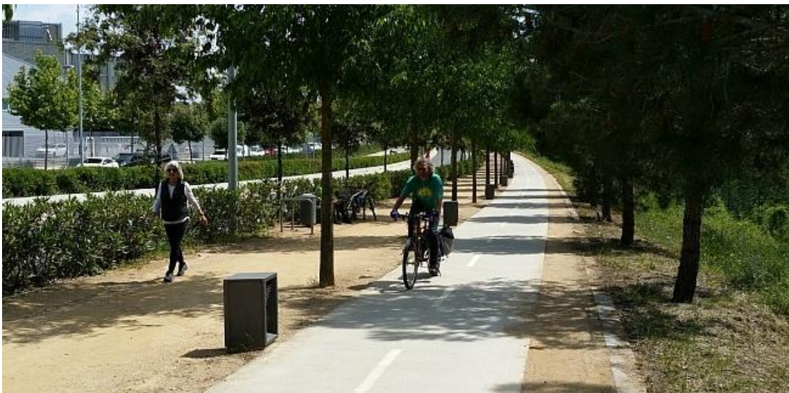
Carril bici del Parc de l'Alba – BSP en direcció Sant Cugat