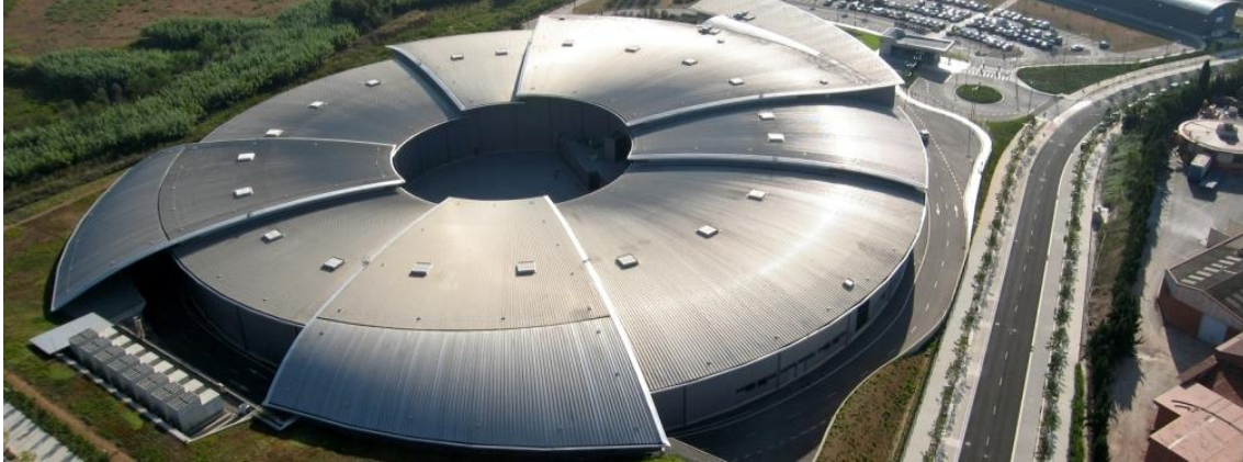
El sincrotró ALBA

El Parc de l'Alba – BSP destina 640.000 m 2 de sol a acollir empreses innovadores d'arreu del món al voltant del sincrotró ALBA, l'equipament científic més important del sud-oest d'Europa.